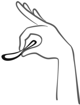
Figuras 3: escolha uma posição confortável para inserir o anel